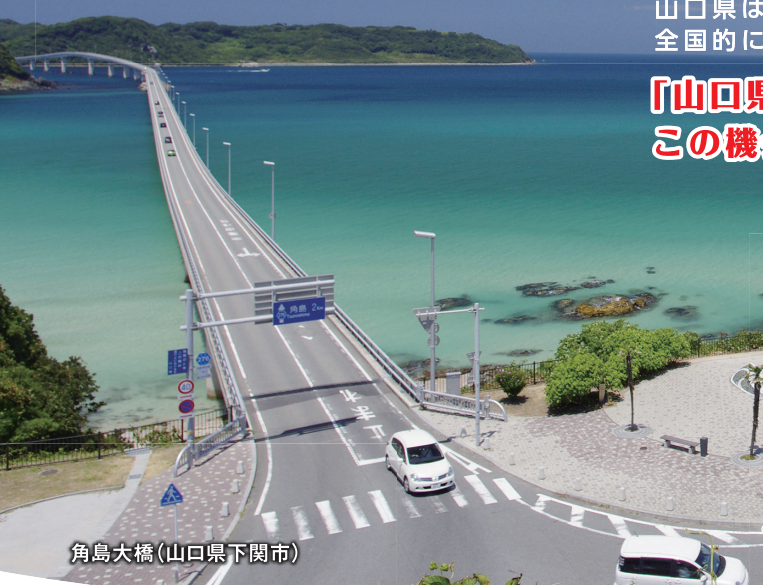
角島大橋(山口県下関市)