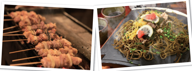
※調理センター利用

テレビドラマで有名になった瓦そばや長州どりの焼鳥など山口の美味しい特産品をたくさんご用意しています。ぜひ、この機会に数ある山口の特産品を味わってください。