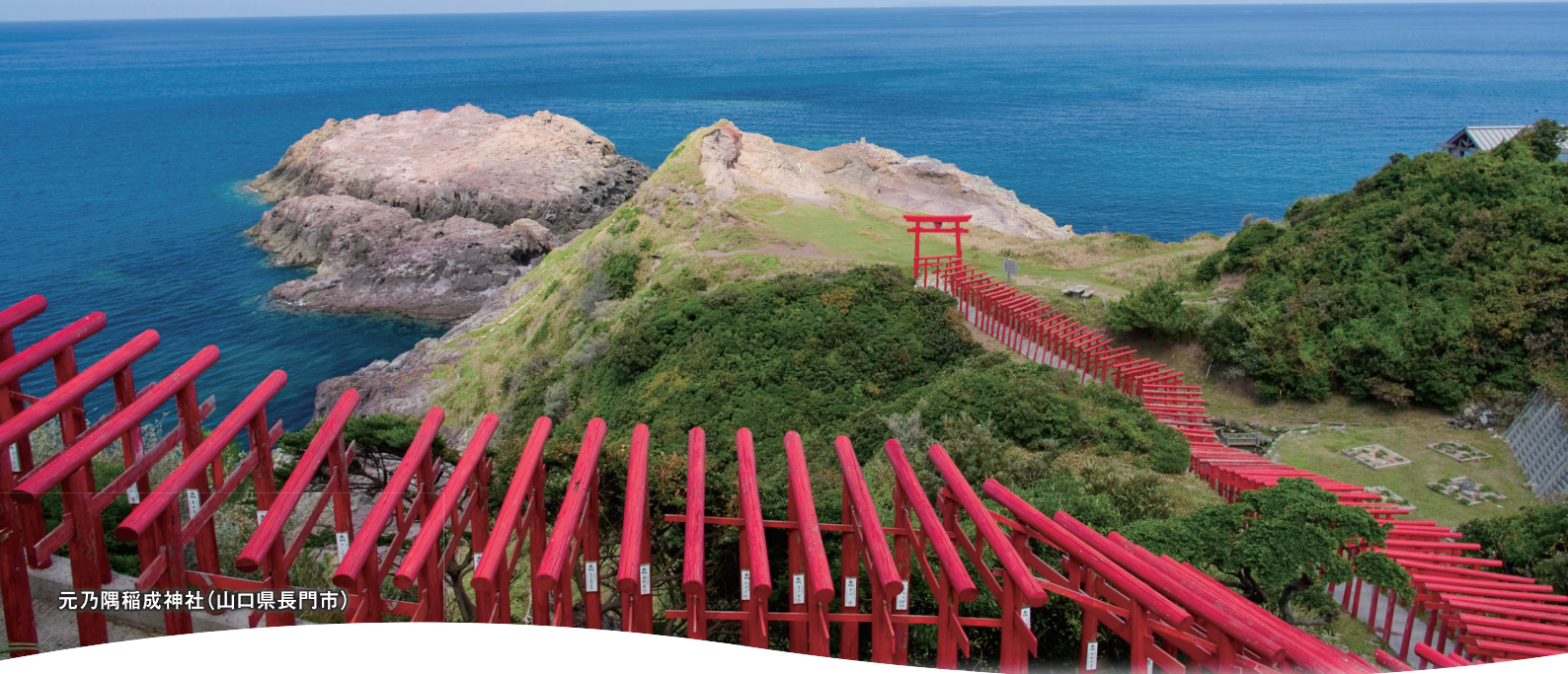
元乃隅稲成神社(山口県長門市)