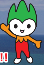
山口県PR本部長 ちよるる

「山口県」が東京フォーラムに1日だけ出現！ この機会に、ぜひ山口県に触れてみてください！！